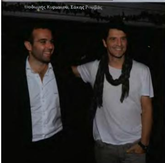
Θοδωής Κυριακού, Σακης Ρουβάς